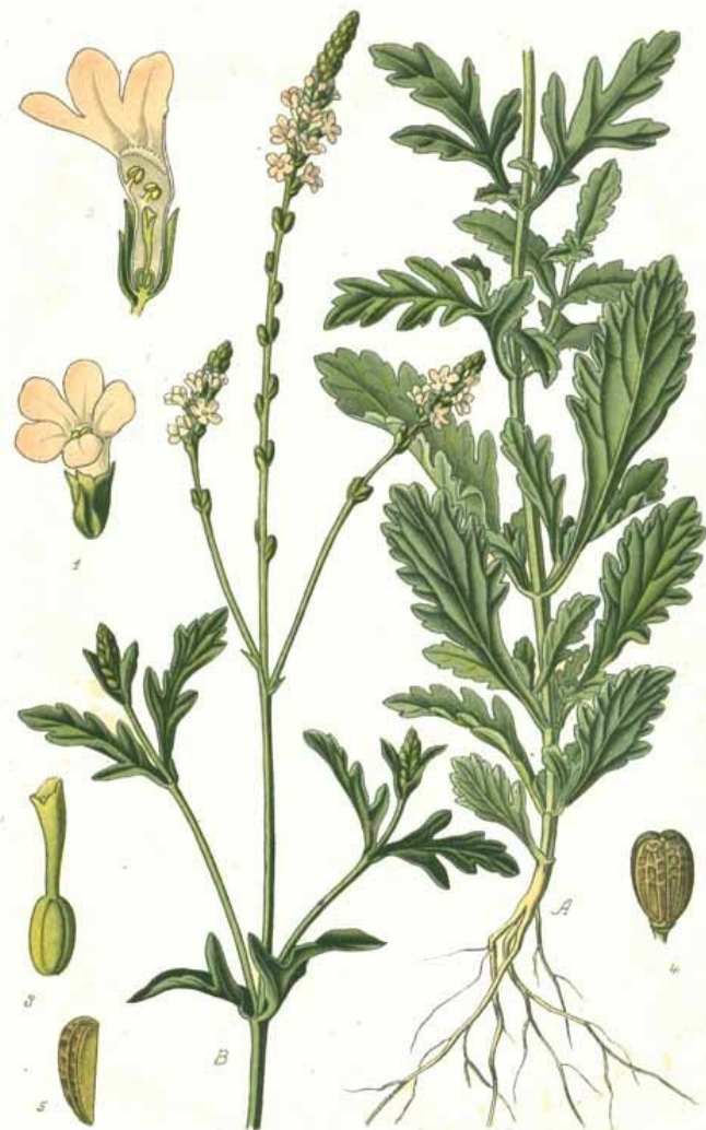
Pl. 270. Verveine officinale. Verbena officinalis L.