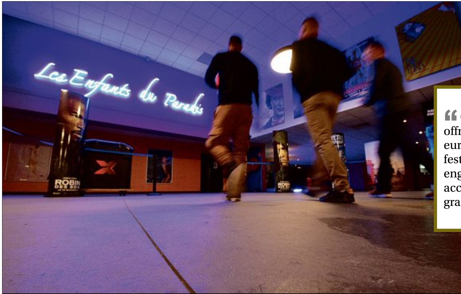
PROGRAMME. Les soirées d'ouverture et de clôture du festival Clap'Adap se dérouleront au cinéma Les Enfants du Paradis, à Chartres.

Pour sa première édition, le festival Clap'Adap, lancé par l'association qui mène des actions autour du climat, sykADAP, aura pour thème l'alimentation et ses enjeux.